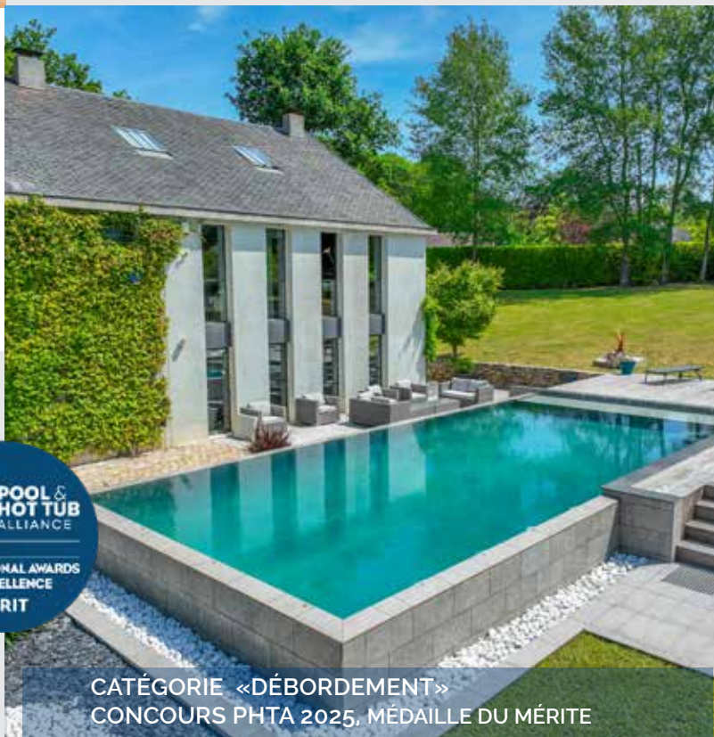
CATÉGORIE «DÉBORDEMENT» CONCOURS PHTA 2025, MÉDAILLE DU MÉRITE