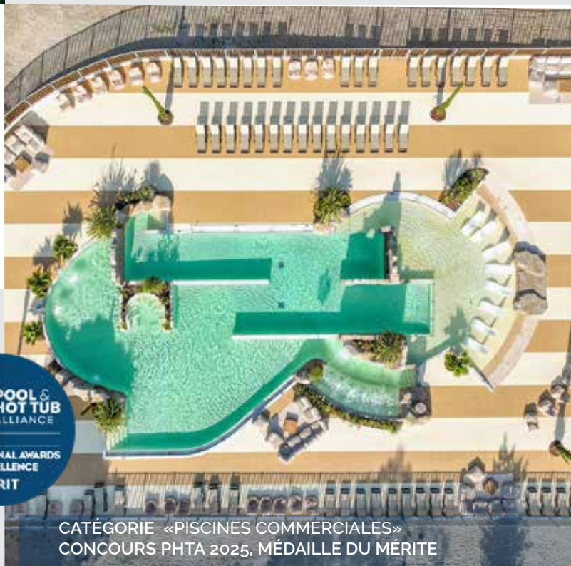
CATÉGORIE «PISCINES COMMERCIALES» CONCOURS PHTA 2025, MÉDAILLE DU MÉRITE