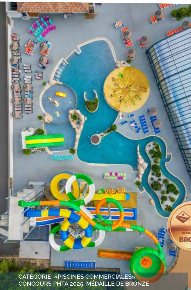
CATÉGORIE «PISCINES COMMERCIALES» CONCOURS PHTA 2025, MÉDAILLE DE BRONZE