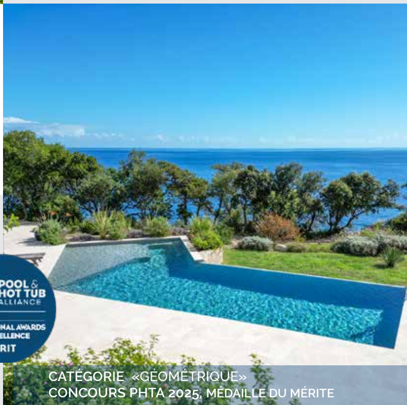
CATÉGORIE «GÉOMÉTRIQUE» CONCOURS PHTA 2025, MÉDAILLE DU MÉRITE