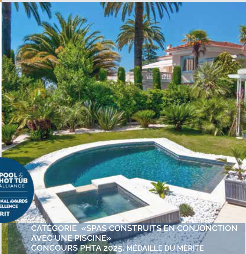
CATÉGORIE «SPAS CONSTRUITS EN CONJONCTION AVEC UNE PISCINE» CONCOURS PHTA 2025, MÉDAILLE DU MÉRITE