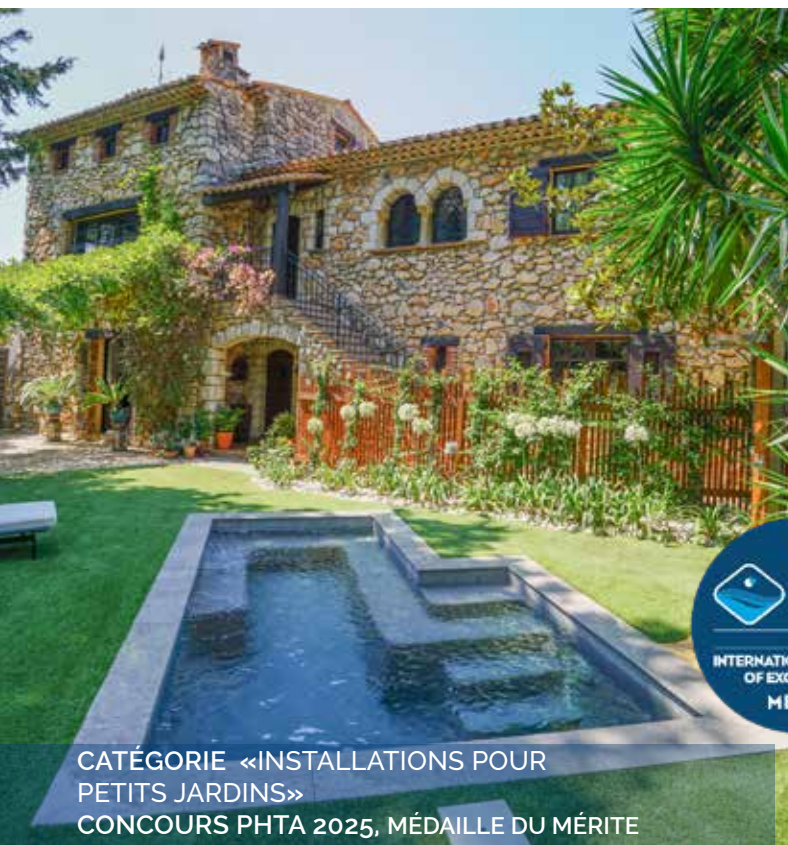
CATÉGORIE «INSTALLATIONS POUR PETITS JARDINS» CONCOURS PHTA 2025, MÉDAILLE DU MÉRITE