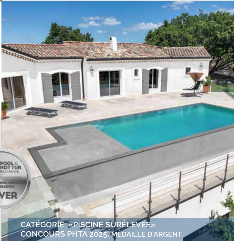
CATÉGORIE «PISCINE SURÉLEVÉE» CONCOURS PHTA 2025, MÉDAILLE D'ARGENT