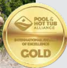
CATÉGORIE «PISCINE SURÉLEVÉE» CONCOURS PHTA 2025, MÉDAILLE D'OR