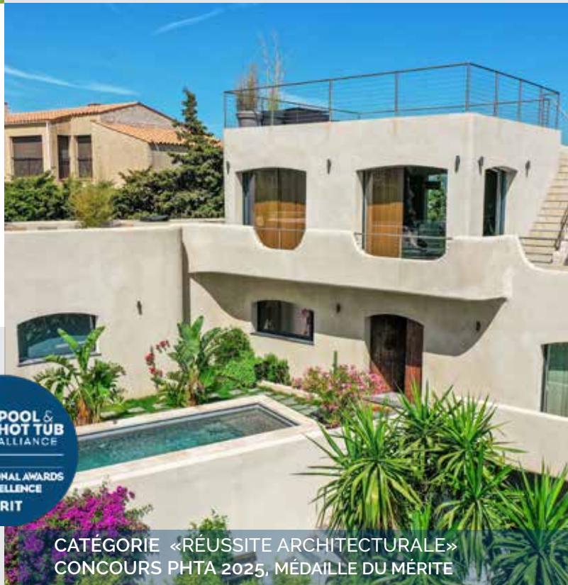
CATÉGORIE «RÉUSSITE ARCHITECTURALE» CONCOURS PHTA 2025, MÉDAILLE DU MÉRITE