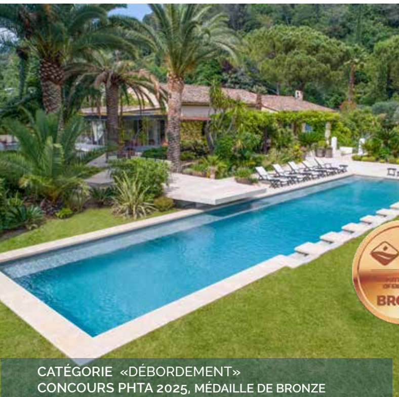
CATÉGORIE «DÉBORDEMENT» CONCOURS PHTA 2025, MÉDAILLE DE BRONZE