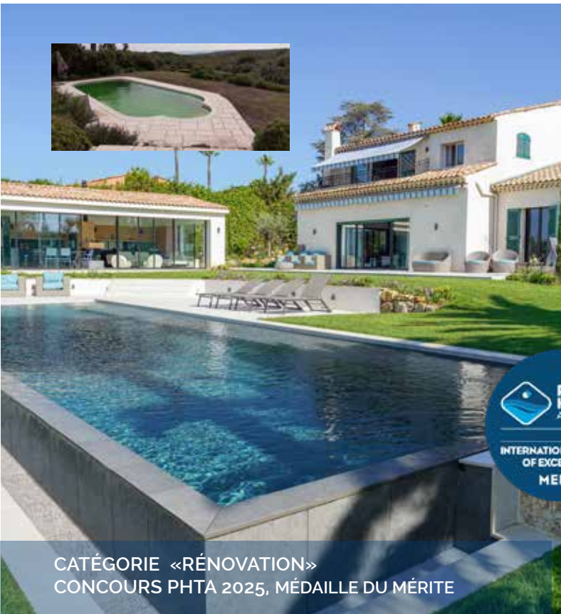
CATÉGORIE «RÉNOVATION» CONCOURS PHTA 2025, MÉDAILLE DU MÉRITE